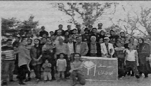
Qaşqay aydınlarının bir qrupu ailələri ilə birlikdə Baba Kuhinin məzarını ziyarət edərkən