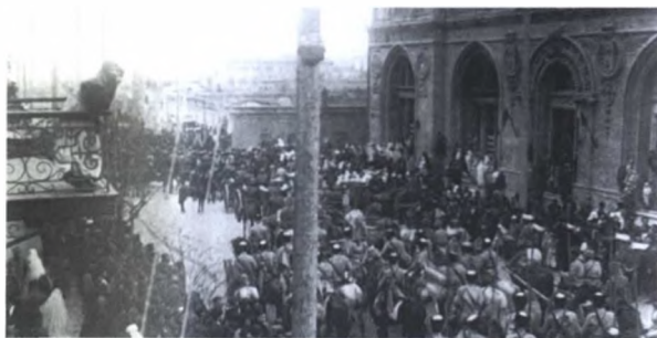
Парад частей армии АДР в апреле 1919 года в Баку за весь недолгий период ее существования.