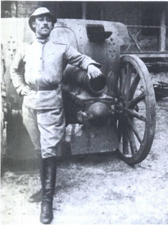
Артиллерист армии АДР

министерства стал перезабазироваться обратно в Баку . Генеральный и общий штабы были размещены в здании на пересечении Красноводской и Меркурьевской (ныне – улицы Самеда Вургуня и проспекта Зарифы Алиевой) улиц (3).