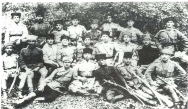
Группа офицеров армии АДР