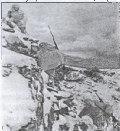
ŞƏKİL 3. QAFQAZ DAĞLARINDA DÖYÜŞ

SSRİ üçün Şimali Qafqazda ağır şəraitin yaranmasının səbəblərindən biri səhv milli siyasət idi. Hələ XX əsrin 20-ci illərindən etibarən regionda qurulmuş Sovet hakimiyyəti əvvəlki çar hökumətinin müstəmləkə siyasətini davam etdirir, bütün tədbirlər milli və dini xüsusiyyətlər nəzərə alınmadan həyata keçirilirdi. Sovetlərin yeritdiyi siyasətə qarşı yönələn ən kiçik etirazlar "banditizm" adlandırılaraq ən qəddar üsullarla yatırılırdı. 1939-cu il sentyabrın 1-də qəbul edilən "Ümumi hərbi mükəlləfiyyət haqqında Qanun"a əsasən 18 yaşına çatmış bütün sovet vətəndaşları hərbi xidmətə çağırılırdı. Tədqiqatçı A.Be-