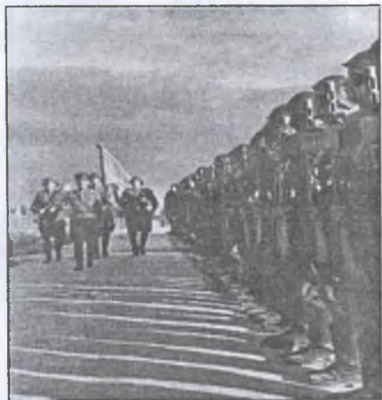
ŞƏKİL 4. DAĞISTANLILARDAN İBARƏT MİLLİ DİVİZİYANIN FORMALAŞDIRILMASI

zuqolnının araşdırmaları göstərir ki, Qafqazdan olan çağırışçıların əksəriyyəti Almaniya ilə həmsərhəd olan qərb hərbi dairələrinə göndərilirdi. (10,150) Milli hərbi hissələr, milli zabıt kadrları da qərb sərhədində cəmləşdirilirdi (məsələn, 77-ci Azərbaycan dağ-atıcı diviziyası SSRİ-nin cənub sərhədinə gətirilmiş, bir çox azərbaycanlı zabıtlər kimi tank qoşunları kapitanı Həzi Aslanov Belorusiyaya təyinat almışdı və s.). Nəticədə müharibənin ilk aylarında milli hissələr məğlub edilmiş, milli zabıt kadrlarının əksəriyyəti həlak olmuş və ya əsir düşmüşdür. Orduya yeni çağırılanların əksəriyyəti nəinki hərbi işi, hətta rus dilini bilmirdilər. Bu, döyüş əməliyyatlarında özünü göstərmişdir. Bir çox hallarda hərbi rəhbərlik öz səhvlərini ört-basdır etmək üçün məğlubiyyəti milli diviziyaların qorxaqlığı, fərsizliyi ilə bağlayırdı. 396-cı Azərbaycan milli atıcı diviziyası Kerç-Feodosiya əməliyyatına aviasiya, artilleriya, tank dəstəyi olmadan döyüşə göndərilmiş, nəticədə 8 min döyüşçüdən 150 nəfər sağ qalmışdır. İtkin və ya əsir düşmüş döyüşçülərin ailələri repressiyalara məruz qalırdı. Şovinst komandirlərin niyyətini anlayan bir çox qafqazlı döyüşçülər almanlar tərəfə keçirdilər. Antiazərbaycan qüvvələrinin səylərinə baxmayaraq, M.C.Bağirov İ.Stalini azərbaycanlıların sadıqlığına inandıra bilmiş, yeni milli Azərbaycan diviziyalarının yaradılmasına, Azərbaycanda yeni hərbi məktəblərin açılmasına nail olmuşdur. (3; 4)